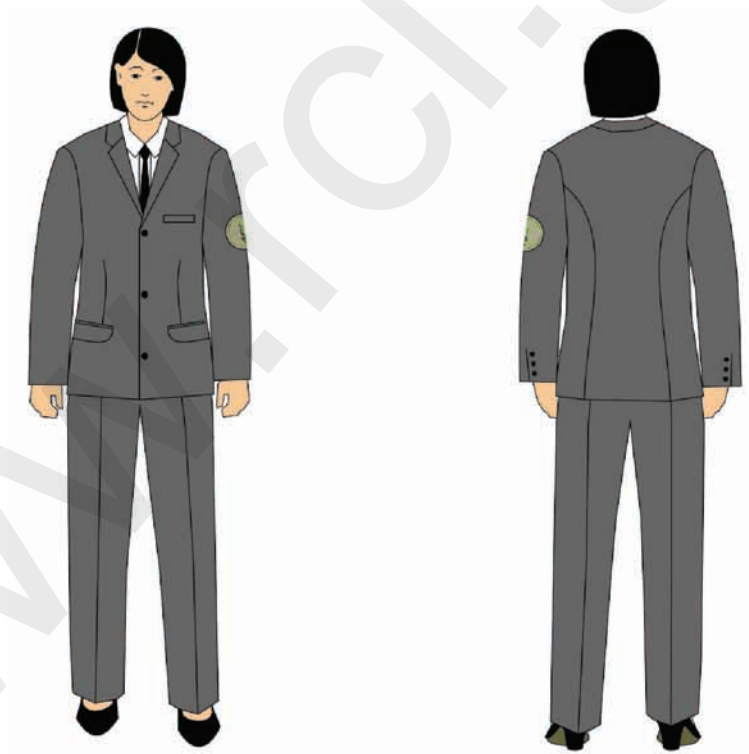
marynarka i spodnie