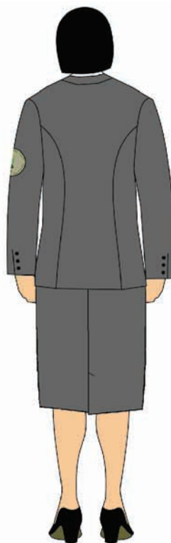
marynarka i spódnica