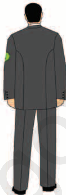
marynarka i spodnie