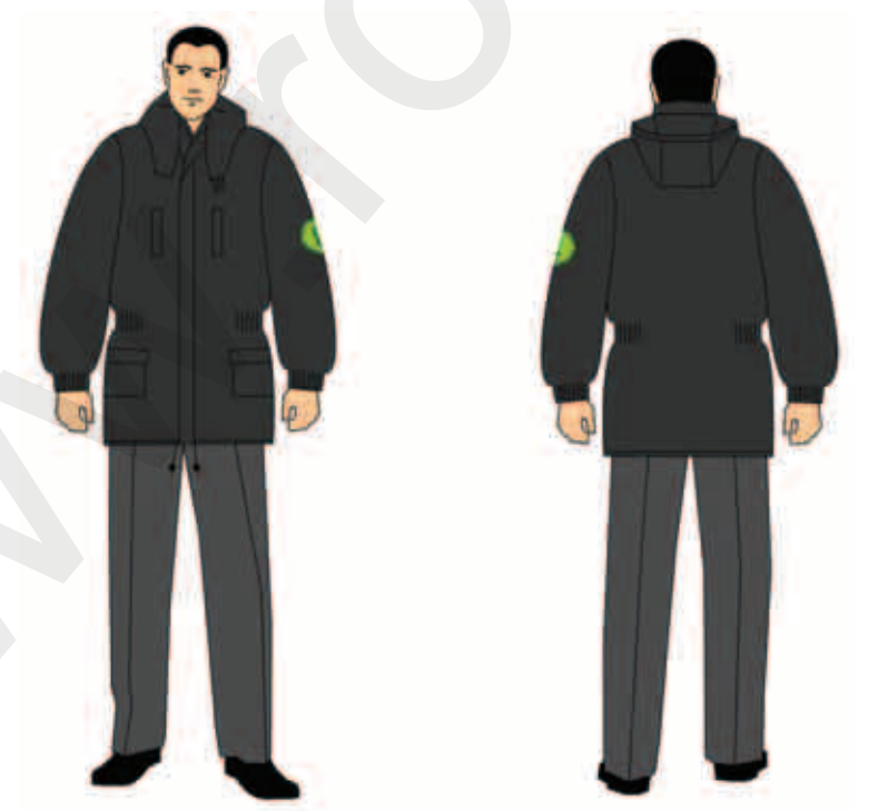
kurtka \frac{3}{4} i spodnie