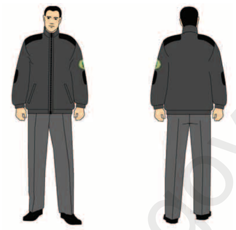
sweter typu „polar” i spodnie