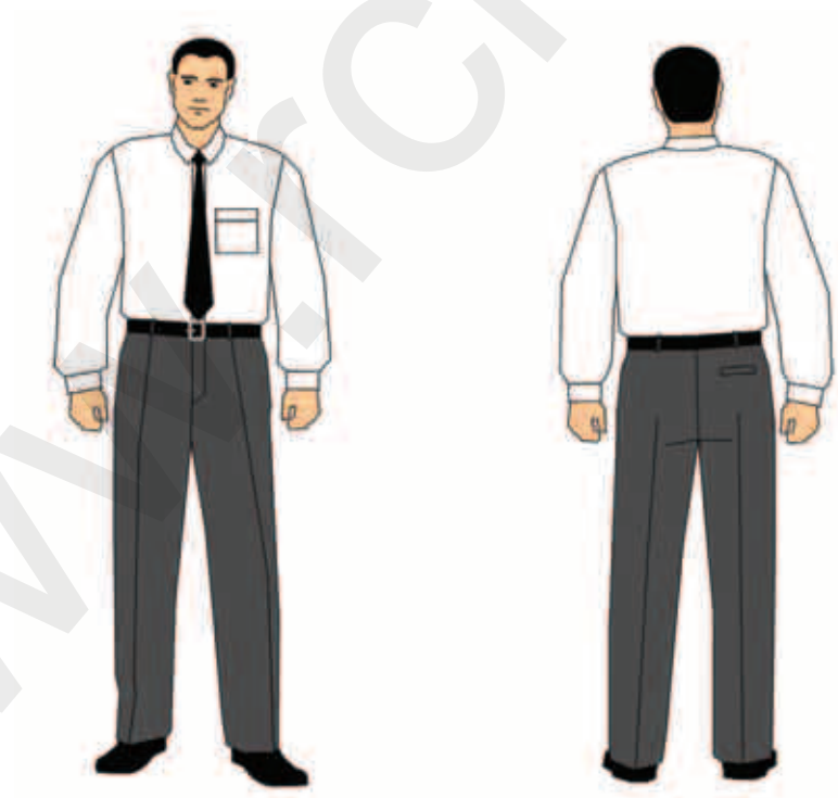
koszula z długim rękawem i spodnie