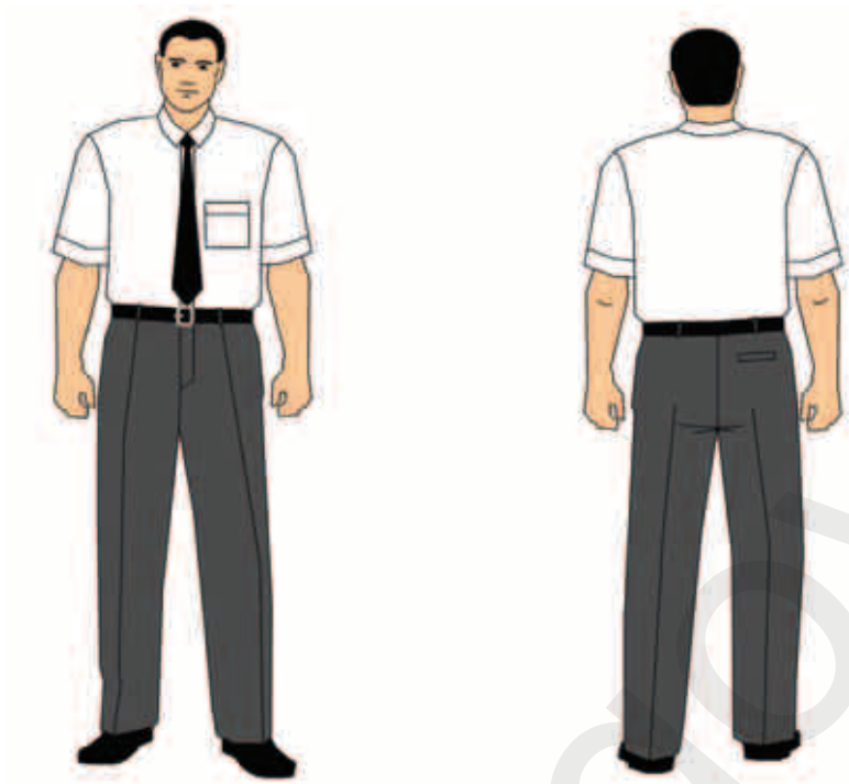
koszula z krótkim rękawem i spodnie