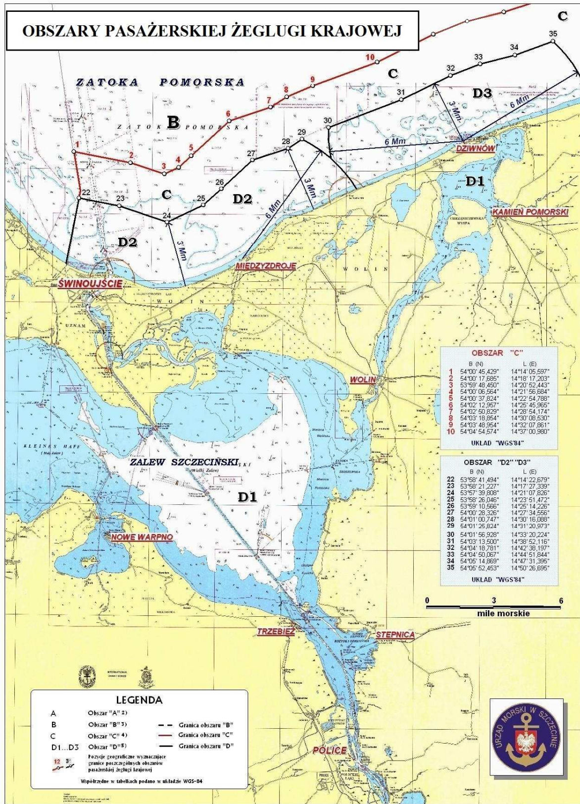
Rys. 2. Wykaz obszarów pasażerskiej żeglugi krajowej leżących we właściwości terytorialnej Dyrektora Urzędu Morskiego w Szczecinie