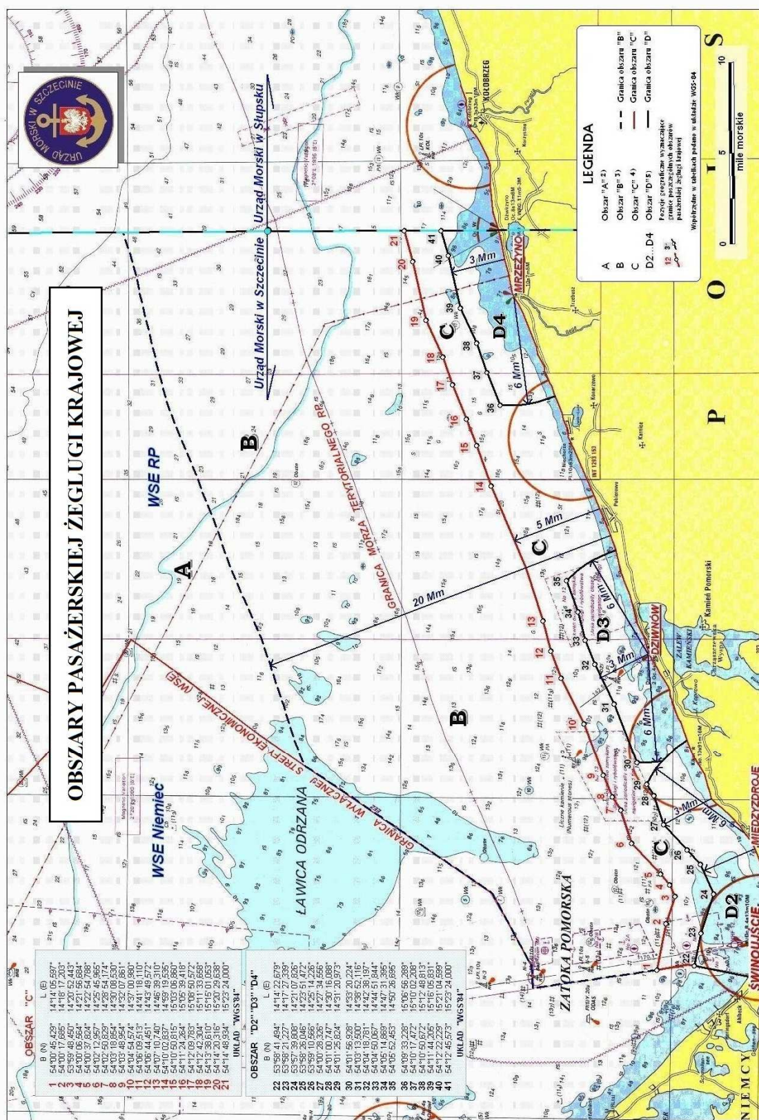
Rys. 1. Wykaz obszarów pasażerskiej żeglugi krajowej leżących we właściwości terytorialnej Dyrektora Urzędu Morskiego w Szczecinie