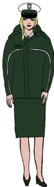
Ubiór uprawnionego w kurtce \frac{3}{4} – dla kobiety 1)