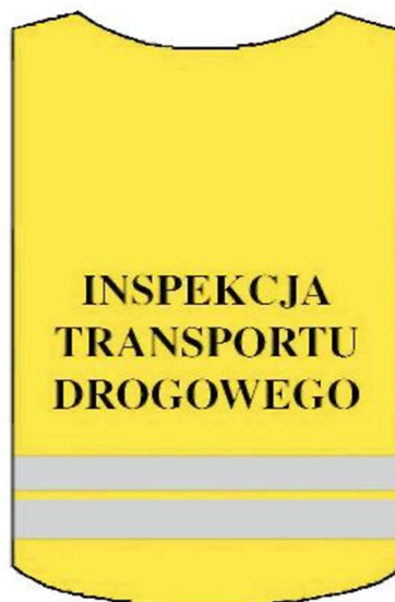
kamizelka ostrzegawcza – tył