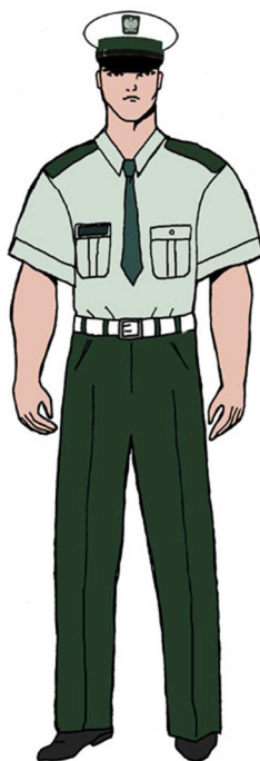
Ubiór uprawnionego w koszuli służbowej z krótkim rękawem – dla mężczyzny 4)