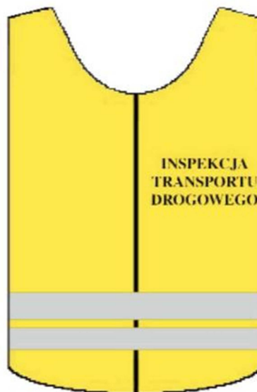
kamizelka ostrzegawcza – przód