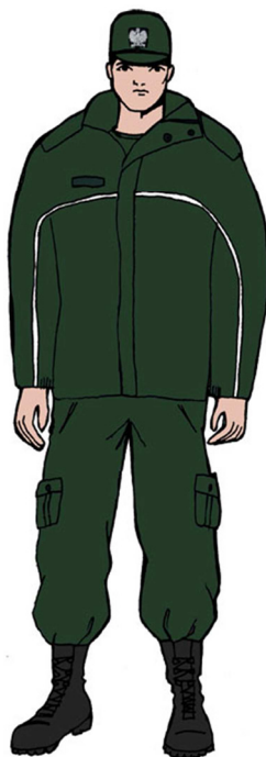
Ubiór uprawnionego w kurtce 3 / 4