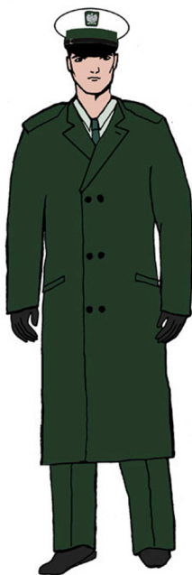
Ubiór Głównego Inspektora Transportu Drogowego (jego zastępcy) oraz wojewódzkiego inspektora transportu drogowego (jego zastępcy) w płaszczu