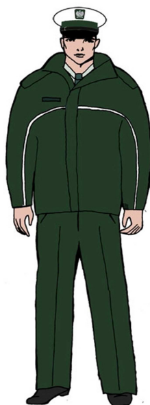
Ubiór uprawnionego w kurtce \frac{3}{4} – dla mężczyzny