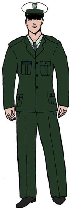
Ubiór uprawnionego w marynarce gabardynowej – dla mężczyzny