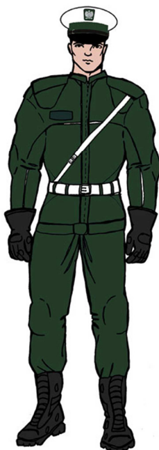
Ubiór uprawnionego – motocyklisty 5)