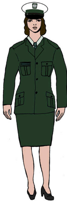
Ubiór uprawnionego w marynarce gabardynowej – dla kobiety 2)