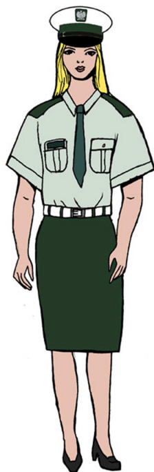
Ubiór uprawnionego w koszuli służbowej z krótkim rękawem – dla kobiety 3)