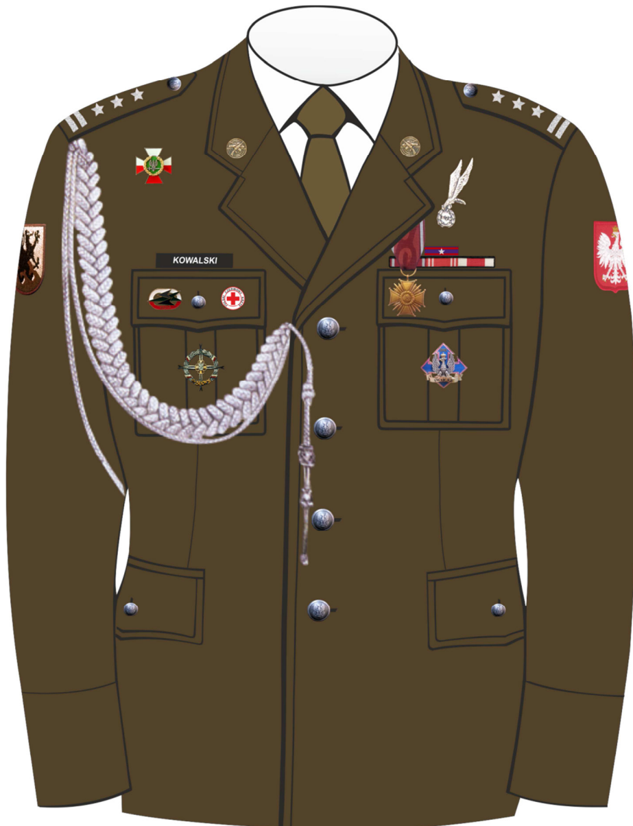
Rys. 2. Sposób noszenia odznak orderów, odznaczeń i odznak na kurtce munduru galowego Wojsk Lądowych.