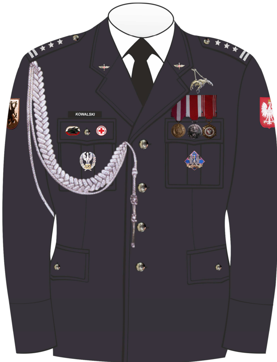
Rys. 3. Sposób noszenia odznak orderów, odznaczeń i odznak na kurtce munduru galowego Sił Powietrznych.