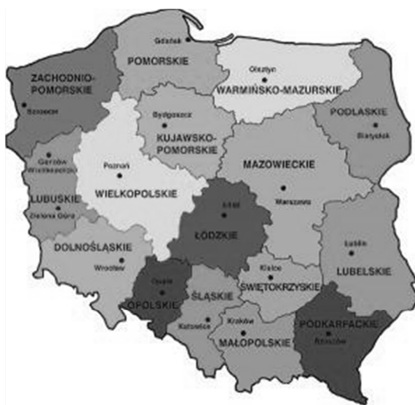
Rys. 3. Podział administracyjny Rzeczypospolitej Polskiej na województwa

Program będzie realizowany na terytorium Rzeczypospolitej Polskiej. Podział administracyjny przedstawia rys. 3