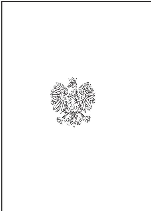
Zewnętrzna strona legitymacji