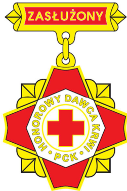
Brązowa odznaka honorowa „Zasłużony Honorowy Dawca Krwi III stopnia”