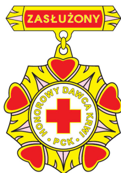
Złota odznaka honorowa „Zasłużony Honorowy Dawca Krwi I stopnia”