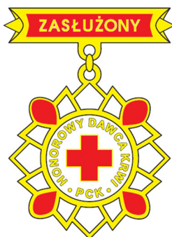
Srebrna odznaka honorowa „Zasłużony Honorowy Dawca Krwi II stopnia”