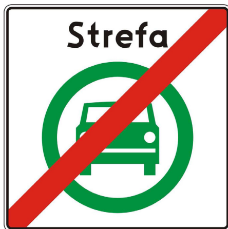
Rys. 5.2.60.1 Znak D-55

Znak D-55 „Koniec strefy czystego transportu” stosuje się w celu wskazania wyjazdu ze strefy czystego transportu. Znak ten umieszcza się na wszystkich wyjazdach ze strefy czystego transportu.”,