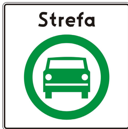
Rys. 5.2.59.1. Znak D-54

Znak D-54 „Strefa czystego transportu” stosuje się w celu wskazania granicy strefy czystego transportu. Znak ten umieszcza się na wszystkich wjazdach do strefy czystego transportu.