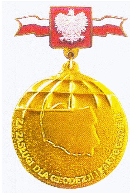
Wzór w powiększeniu