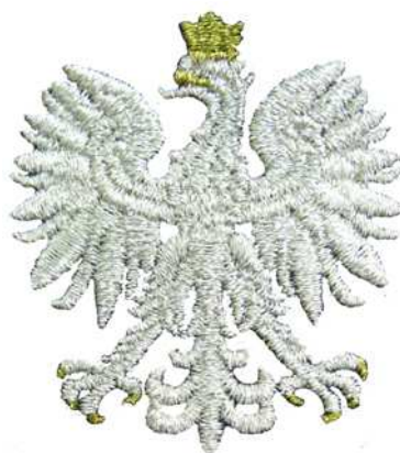
Znak generalnego inspektora i nadinspektora Policji