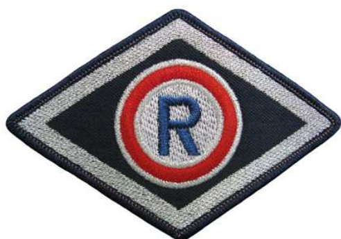
Służba prewencyjna (komórki organizacyjne ruchu drogowego)