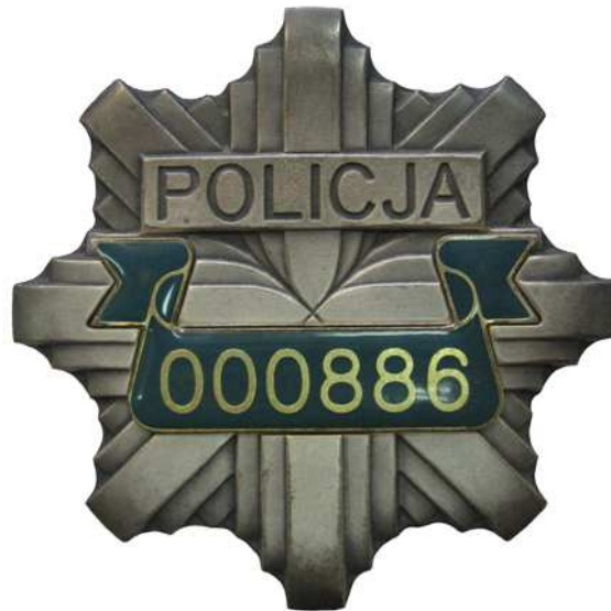
Znak identyfikacji indywidualnej policjanta