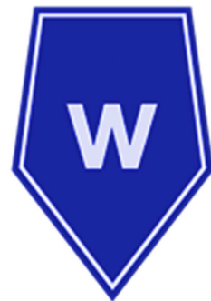
Służba spraw wewnętrznych