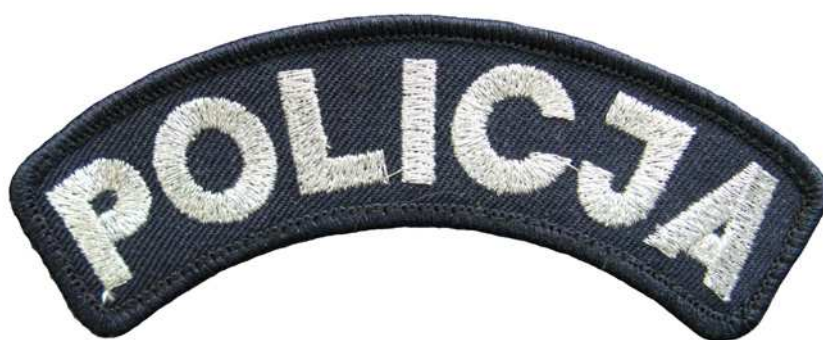
Znak do kurtki galowej i płaszcza wyjściowego całorocznego