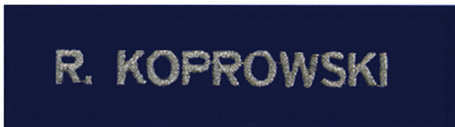
Znak identyfikacji imiennej w postaci taśmy szczonej