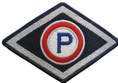
Służba prewencyjna (z wyłączeniem komórek organizacyjnych ruchu drogowego)