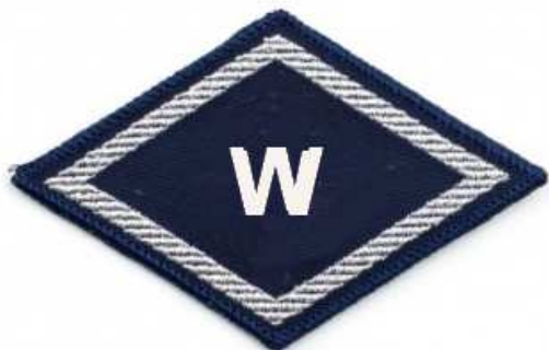
Służba spraw wewnętrznych