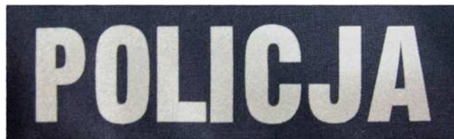
Znak do elementów ubioru służbowego i munduru ćwiczebnego