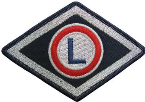
Służba wspomagająca, Wyższa Szkoła Policji w Szczytnie, szkoły policyjne i ośrodki szkolenia Policji