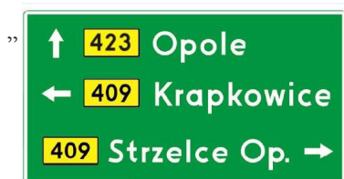
Rys. 6.3.2.1. Drogowskaz E-2a”