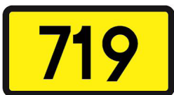
Rys. 6.3.7.2. Znak E-15b”

Znaki E-15b „numer drogi wojewódzkiej” (rys. 6.3.7.2) stosuje się w celu wskazania przebiegu drogi wojewódzkiej lub wjazdu na tę drogę.