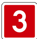
Rys. 6.3.7.1. Znak E-15a:

Znak E-15a „numer drogi krajowej” o tle barwy czerwonej z białą ramką tarczy znaku i napisie barwy białej (rys. 6.3.7.1) stosuje się w celu wskazania przebiegu drogi krajowej oznaczonej numerem wskazanym na znaku lub wjazdu na tę drogę.