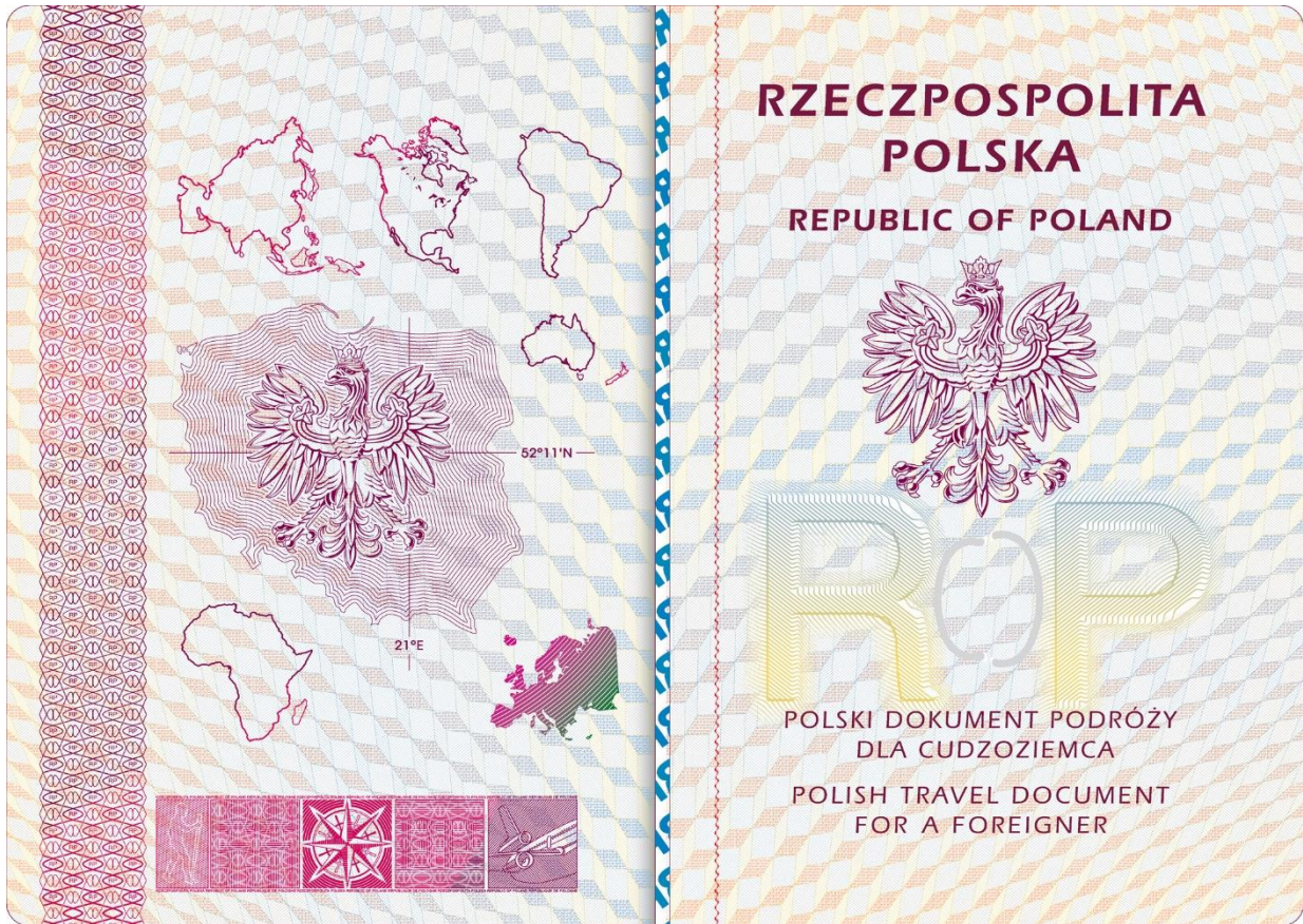
Strona 2 okładki (wewnętrzna)