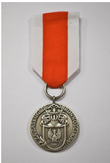
STRONA LICOWA MEDALU