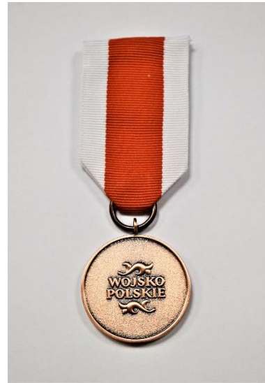
STRONA ODWROTNA MEDALU