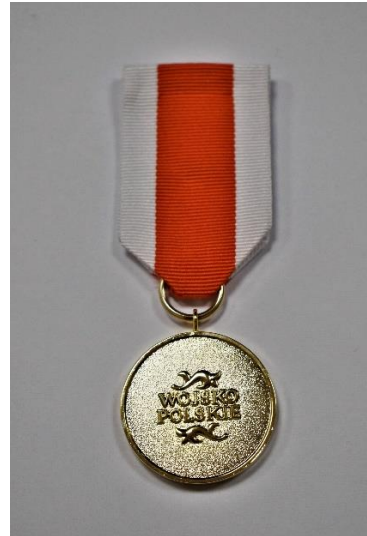
STRONA ODWROTNA MEDALU