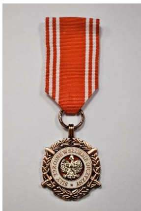
strona licowa medalu