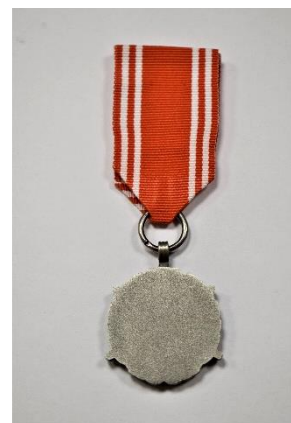
strona odwrotna medalu