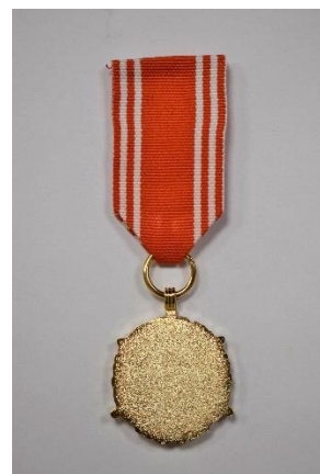
strona odwrotna medalu