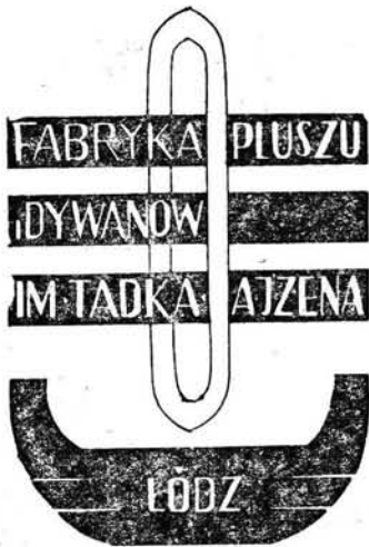
1. Znak fabryczny Fabryki Pluszów i Dywanów im. Tacka Ajzena w Łodzi.