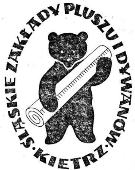
3. Znak fabryczny Śląskich Zakładów Pluszu i Dywanów w Kietrze.