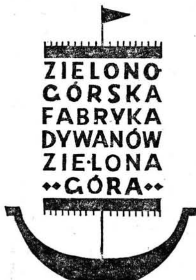
5. Znak fabryczny Zielonogórskiej Fabryki Dywanów (jest to stary znak używany przez Lubuskie Zakłady Tkanin Dekoracyjnych w Żarach).