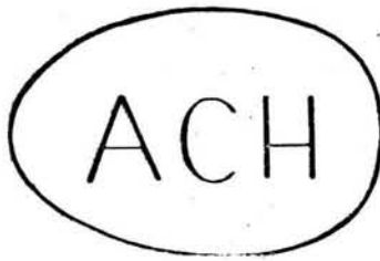
2. „ARS CHRISTIANA” w Warszawie.