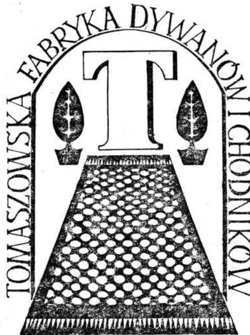
2. Znak fabryczny Tomaszowskiej Fabryki Dywanów i Chodników.