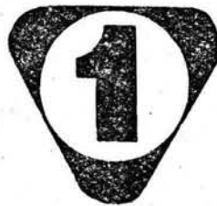
ZNAK JAKOŚCI „1”