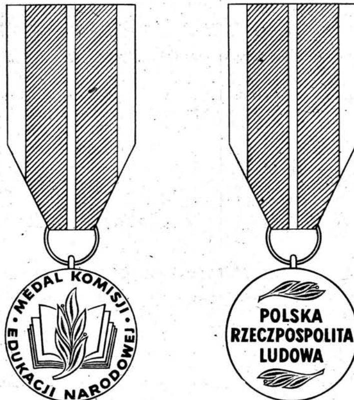
WZÓR „MEDALU KOMISJI EDUKACJI NARODOWEJ”

Załącznik nr 1 do zarządzenia nr 29 Prezesa Rady Ministrów z dnia 13 grudnia 1982 r. (poz. 278)