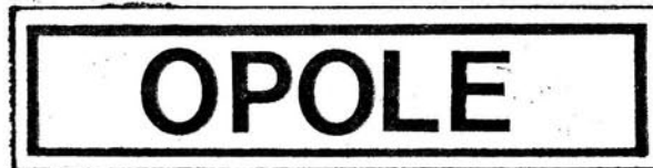
Wzór 54. Funkcjonariusz pełniący służbę w komendzie wojewódzkiej straży pożarnych