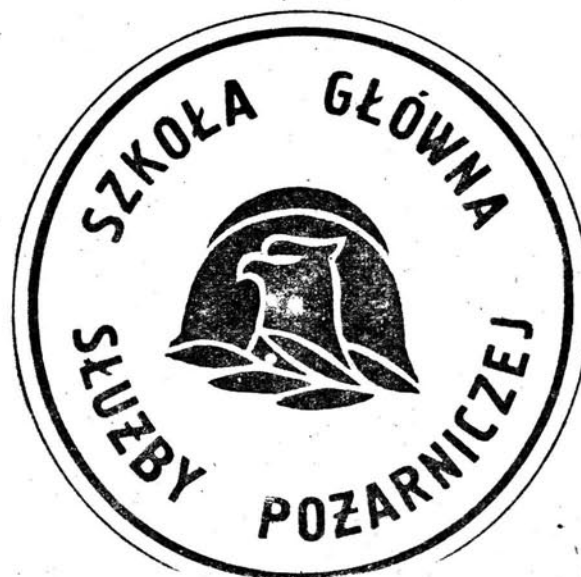
Wzór 57. Funkcjonariusz pełniący służbę w Szkole Głównej Służby Pożarniczej