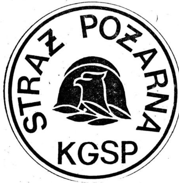
Wzór 56. Funkcjonariusz pełniący służbę w Komendzie Głównej Straży Pożarnej