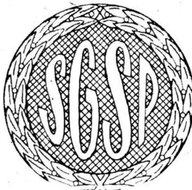
Wzór 46. Oznaka i dystynkcje służbowe na naramiennikach podchorążego Szkoły Głównej Służby Pożarniczej