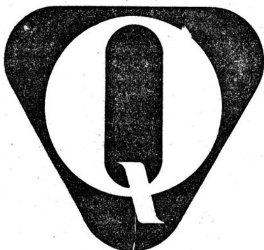
ZNAK JAKOŚCI „Q”