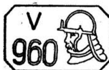
Cecha podstawowa dla próby 0,960