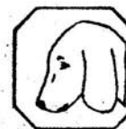
Cecha dodatkowa dla palladu