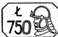
Cecha podstawowa dla próby 0,750