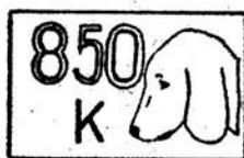
Cecha podstawowa dla próby 0,850