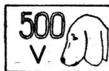
Cecha podstawowa dla próby 0,500