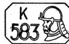
Cecha podstawowa dla próby 0,583