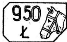
Cecha podstawowa dla próby 0,950